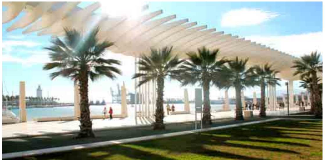
El Palmeral de las Sorpresas es ideal para pasear, tomar algo o disfrutar de una exposición en sus alrededores.

El Entorno Thyssen no es el único distrito renacido. Existe otro, emplazado entre el sur de la Alameda y el Muelle de Heredia, por eje norte-sur, y entre la Plaza de la Marina y el río Guadalmedina, por