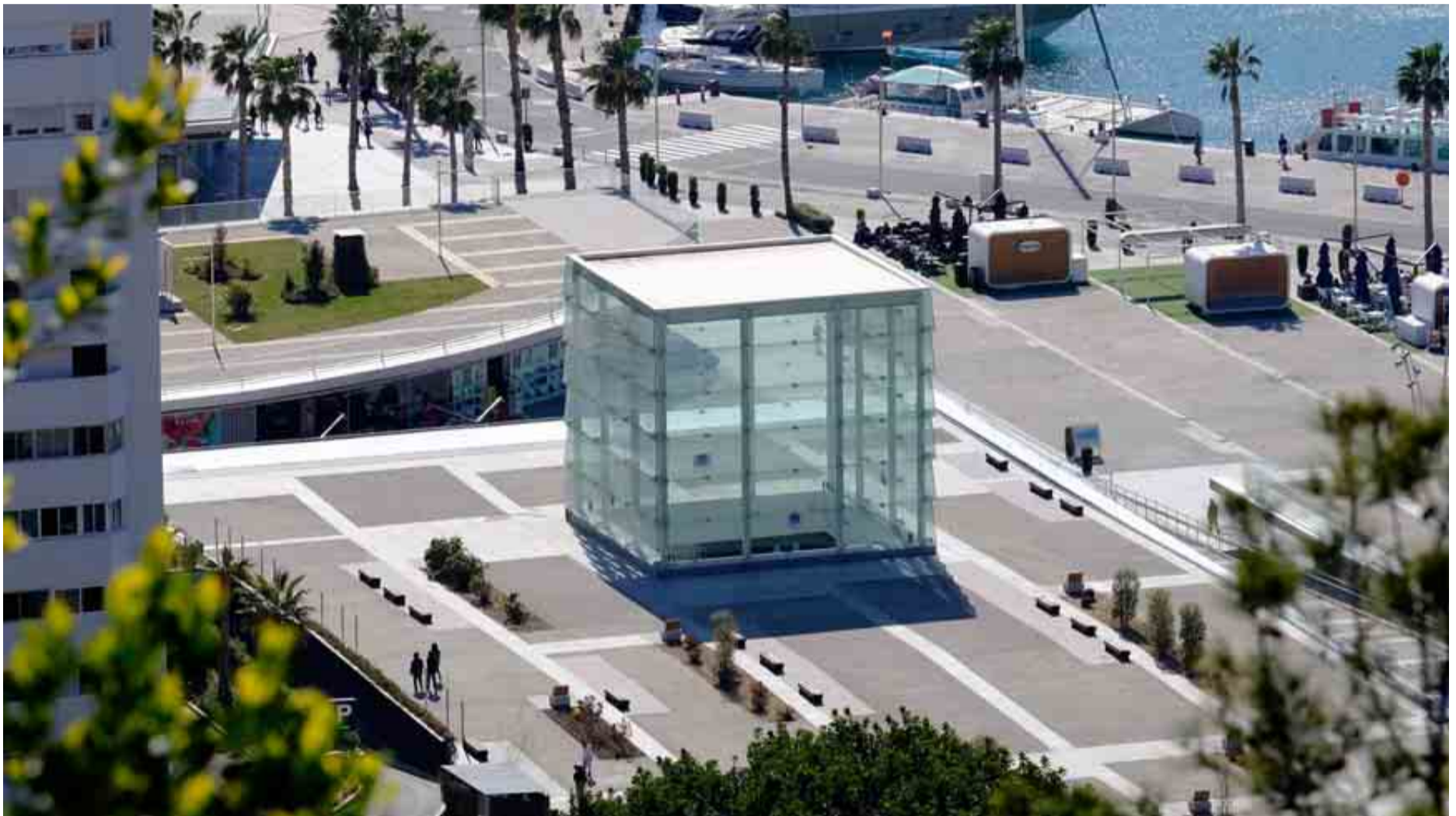
El emblemático edificio del Cubo es la sede de la nueva sucursal del Centro Pompidou francés en la ciudad andaluza, ubicado en pleno puerto. FOTOGRAFÍAS: VIAJES

MÁLAGA La nueva filial del Pompidou galo apunta la eclosión de la ciudad, que reinventa barrios como el 'Entorno Thyssen' o el Soho con hoteles, centros culturales, bares... Adiós al tópico de sólo sol y flamenco