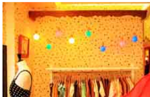
La tienda Dolores Promesas del Entorno Thyssen.

del de otra filial, la del Museo Estatal Ruso de San Petersburgo —dueño de una de las mayores colecciones de obras de artistas de ese país, desde Kandinsky a Chagall—, no han hecho más que apuntalar lo